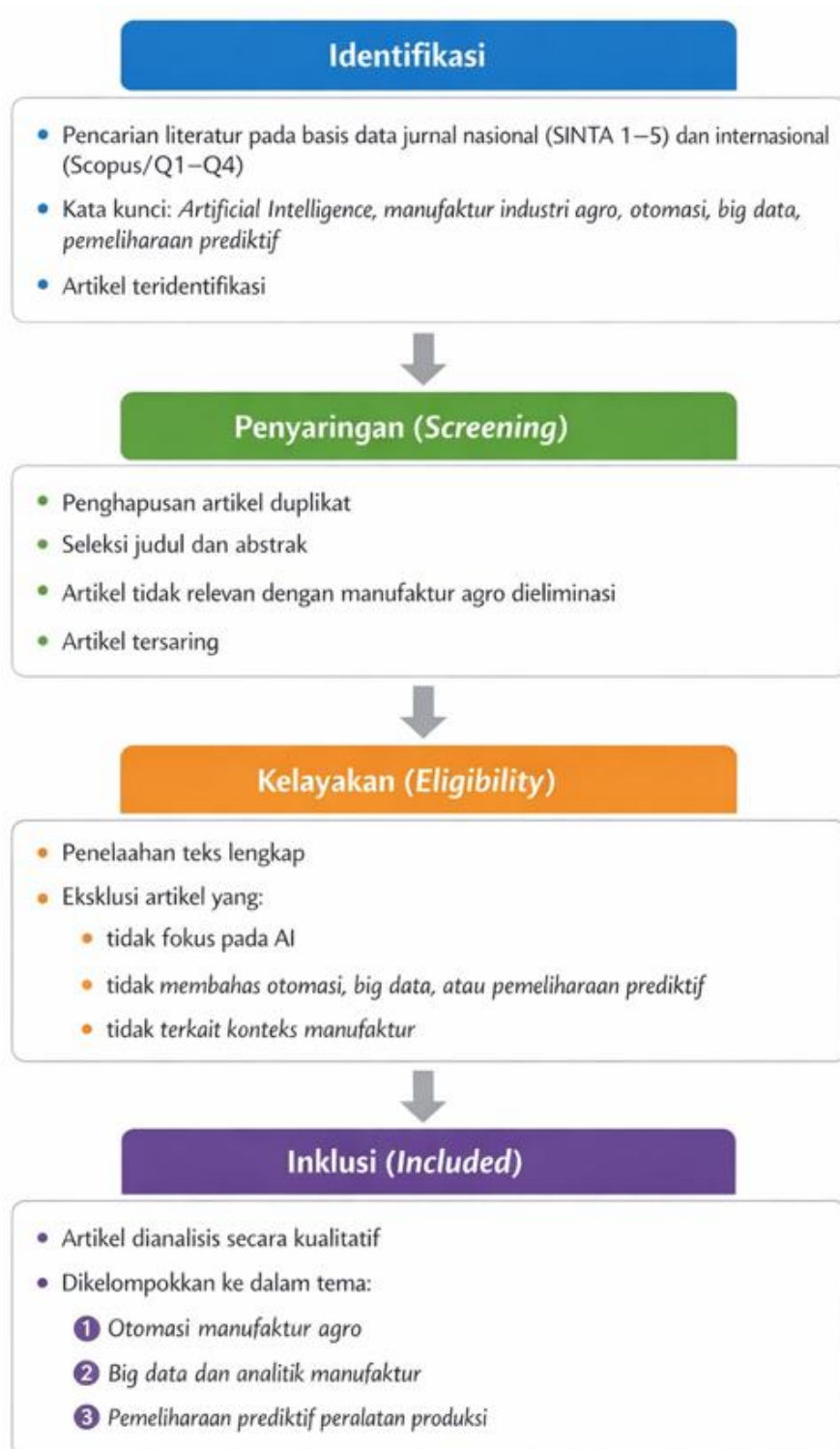
Gambar 1. Diagram alir metode PRISMA