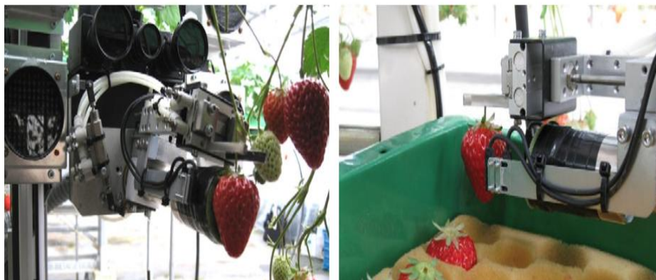
Gambar 3. Pengembangan robot Pemetik Strawberry[48]

Pemanfaatan kecerdasan buatan dalam pemeliharaan prediktif menunjukkan bahwa AI tidak hanya berfungsi sebagai alat pendukung keandalan peralatan, tetapi juga sebagai fondasi pengembangan sistem manufaktur agro yang lebih terintegrasi. Integrasi data operasional, kondisi lingkungan, dan performa peralatan membuka peluang penerapan AI yang lebih luas pada tahapan produksi lainnya[44], [45]. Dalam konteks ini, pengembangan sistem berbasis robot dan pendekatan pertanian presisi menjadi bagian dari perluasan fungsi AI yang tidak lagi terbatas pada pengendalian dan pemeliharaan, tetapi juga mencakup pengelolaan aliran bahan baku, konsistensi kualitas input produksi, dan sinkronisasi proses manufaktur agro secara menyeluruh [46], [47].